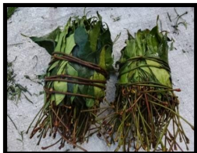
Figure 7. Gnetum africanum