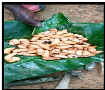
Figure 3. Rhynchophorus phoenicis

La typologie repose également sur le niveau de reconnaissance, allant des produits fermiers authentiques aux produits bénéficiant d'un signe officiel de qualité, comme l'AOP (Appellation d'Origine Protégée) ou l'IGP (Indication Géographique Protégée), qui garantissent la liaison entre le produit, le terroir et le savoir-faire.