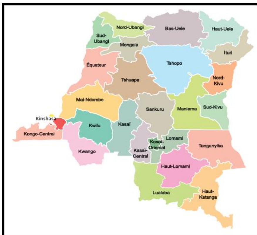
Figure 1. Carte administrative de la RD Congo

Sur une population d'environ 101,5 millions d'habitants (IPC RDC, 2024), harmonieusement répartis au Nord et au Sud de l'Equateur, la RD Congo a des sols forestiers et savaniques fertiles, drainés par un réseau hydrographique important (Umba, 2015). Ce réseau hydrographique, qui est très dense, comprend deux Fleuves, une trentaine de grandes rivières dont toutes les eaux débouchent sur le fleuve Congo. On dénombre 15 lacs d'une superficie totale de 180 000 km 2 avec une potentialité hydroélectrique estimée à 106 000 MW. Elle dispose de l'une des plus riches biodiversités au monde en raison d'innombrables et variables richesses fauniques et floristiques qui les composent (INS RDC, 2021).