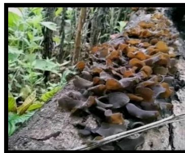
Figure 8. Auricularia auricula-judae