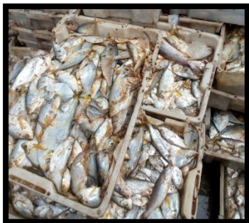
Figure 11. Illustration du résultat de la pêche dans le territoire de Muanda