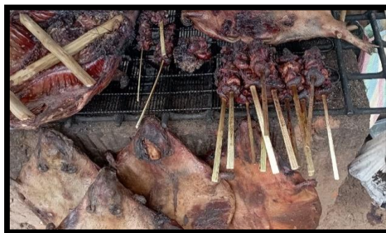
Figure 10. Illustration de quelques brochettes de viandes de brousse vendue le long de la route nationale n°1 sur l'axe routier Matadi – Manterne au Kongo Central

La viande de brousse constitue une source de revenus sûre pour certains ménages et par contre, elle satisfait aussi aux besoins nutritionnels et de sécurité alimentaire par l'apport des protéines animales dans certains ménages paysans (Ngoyi et al. , 2026).