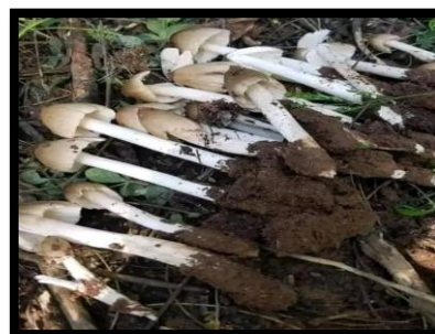
Figure 6. Termitomyces clypeatus