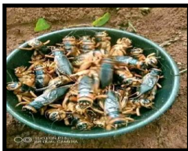
Figure 9. Acheta domesticus Source : Kumpel et al. , (2026)