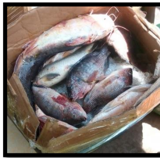
Figure 12. Poissons pêchés et prêts à être expédiés dans les grands centres de consommation Source : Bamueue et al. , (2026)

La transformation locale peut accroître les recettes en créant de la valeur ajoutée, alors que l'exploitation du savoir local peut améliorer la production, la transformation et les possibilités de commercialisation des produits. L'une des clés du succès dans les entreprises de PFNL consiste à ajouter de la valeur à la ressource non ligneuse en la transformant sur place, de façon à ce qu'une part plus grande du prix final revienne aux communautés qui gèrent la ressource (Bakengula et al. , 2025).