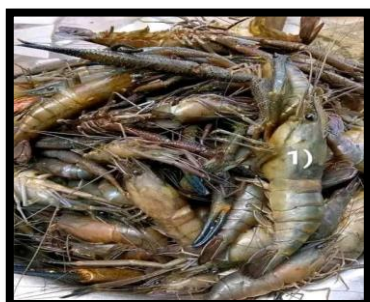
Figure 5. Macrobrachium vollenhovenii