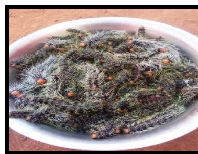
Figure 4. Imbrasia epimethea Source : Kumpel et al. , (2026)