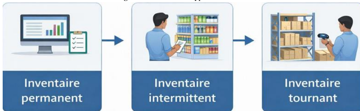
Figure 1: les différents types d'inventaire